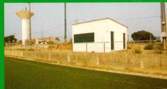
Construção do Bar - Campo Atlético da Ajuda Santana do Mato