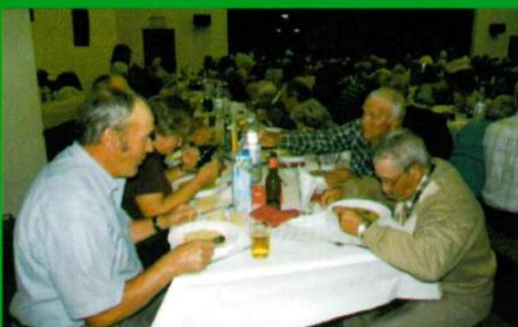
Almoço anual de reformados - 25 de Outubro de 2008