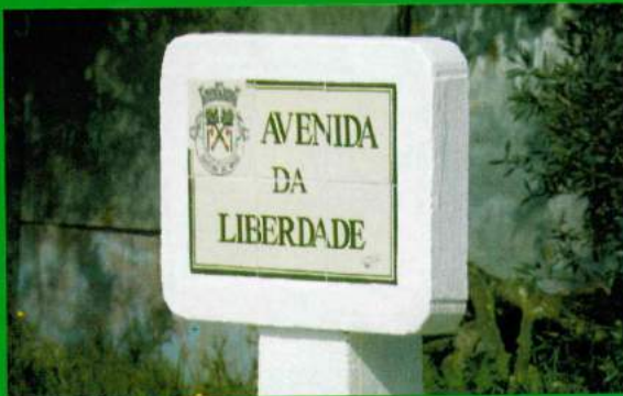
Placas Identificação Ruas - Santana do Mato