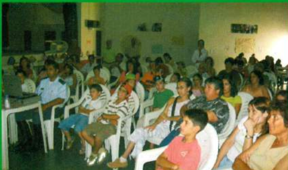
ATL de Verão - Palestra sobre segurança - GNR - 2007