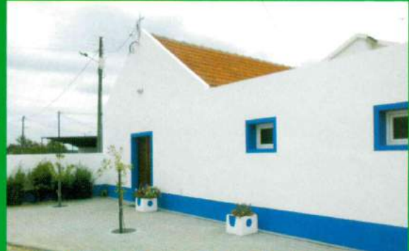
Capela Mortuária Santana do Mato - Construção (Depois)