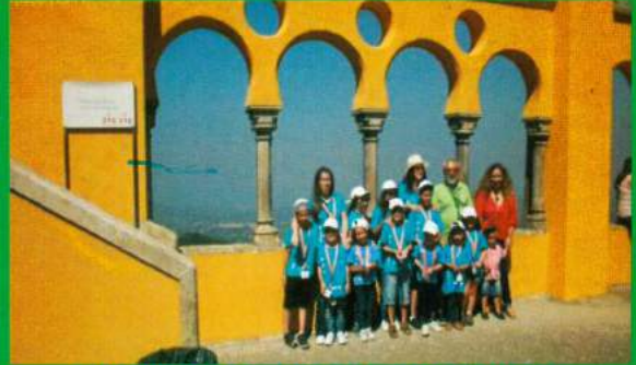
ATL de Verão - Parceria da Freguesia de Santana do Mato / ARCD Santa Ana - 2013