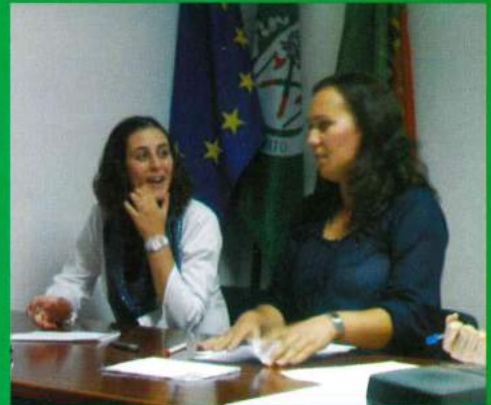
Mesa da Assembleia

Tomada de Posse dos membros da Assembleia de Freguesia, Aqui ficam os momentos mais marcantes: