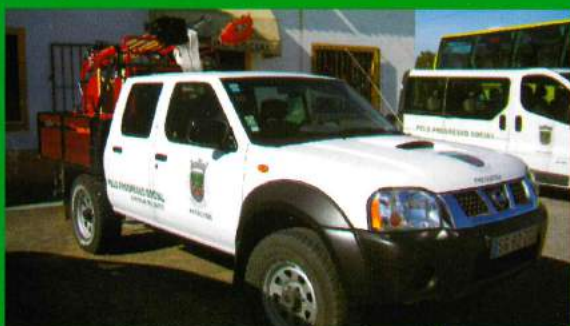
Viatura c/ Kit Primeira Intervenção a Fogos Florestais Adquirida em 2007