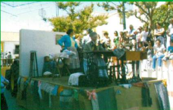
Participação no Cortejo / Festas do Castelo 2011