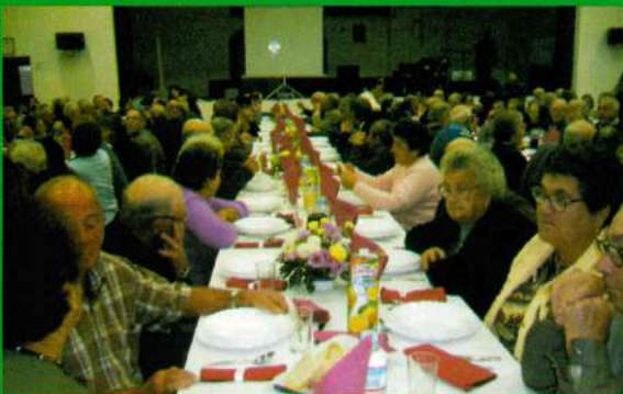
Almoço anual de reformados - 18 de Novembro de 2006