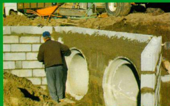
Pontão Rua Pinheiro - Carapuções (Obras)