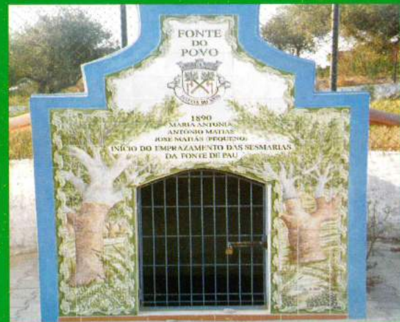
Fonte do Povo - Azinhaga do Povo Reconstrução