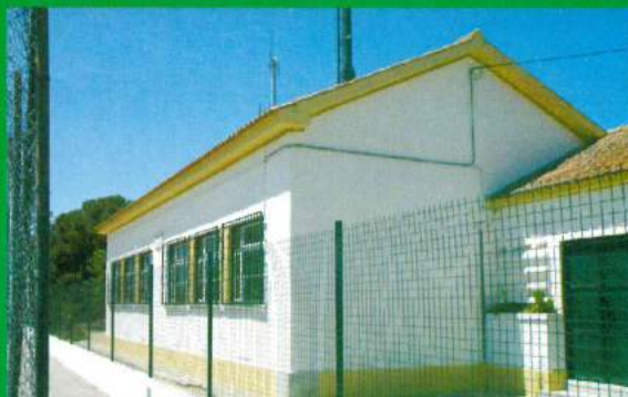
Grande Reparação na Escola Primária - Santana do Mato