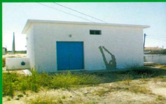
Caseta e Furo - Santana do Mato