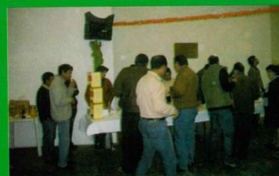
Festa de Natal dos Alunos da Freguesia de Santana do Mato Entrega de Presentes