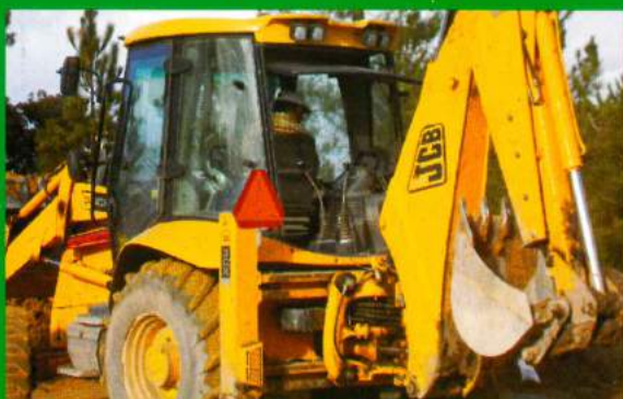
Recto-escavadora - Viatura Adquirida em 2007