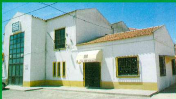
Asfaltamento Largo e Reparação / Conservação Centro Social - Santana do Mato