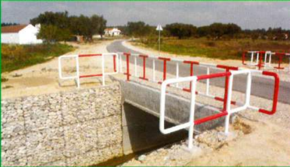
Caminho Agrícola - Brejoeira (Parceria Freguesia de Santana do Mato / Ministério da Agricultura / Município de Coruche)