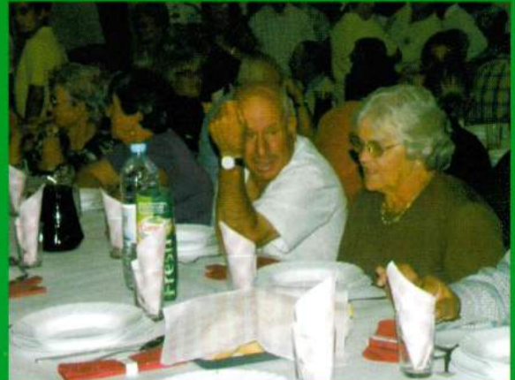
Almoço anual de reformados - 20 de Setembro de 2009