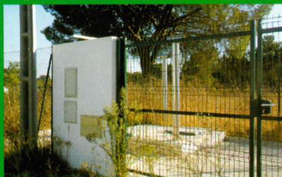
Rede de Esgotos - Santana do Mato