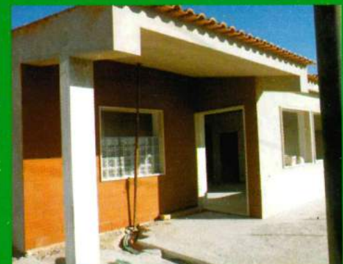
Inst. Edifício Sede Depois de Obras de Reconstrução