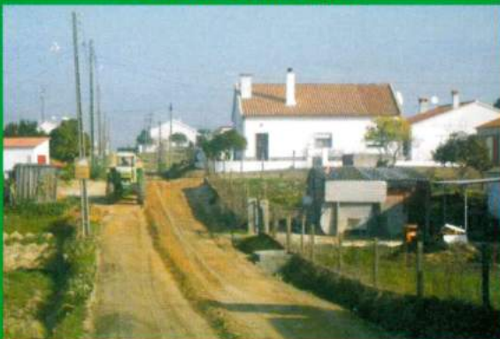
Conservação de Ruas - Santana do Mato