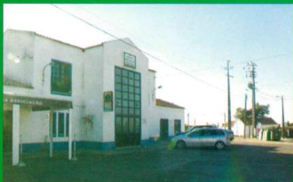
Centro Social - Santana do Mato - Pintura