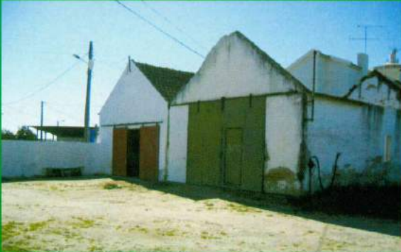
Capela Mortuária Santana do Mato - Construção (Antes)