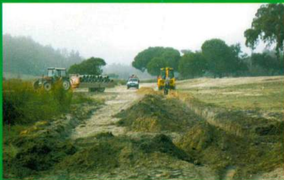
Reabertura da Estrada Santana - Terrafeito - Varzea da Cruz - Terrafeirinho