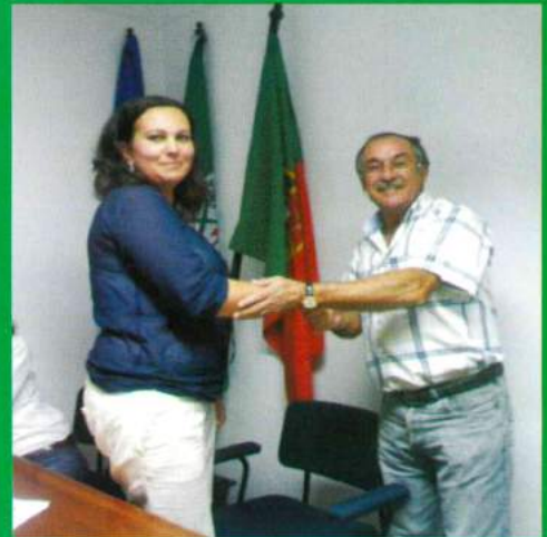
Passagem do testemunho