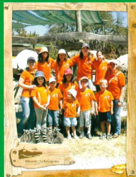
ATL de Verão - Parceria da Freguesia de Santana do Mato / ARCD Santa Ana - 2013