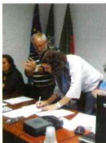
1ª Secretária Carla Coelho (PS)