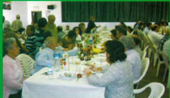
25 de Abril - Almoço C. Social Santana