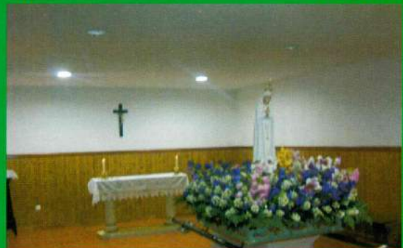
Capela Mortuária Santana do Mato - Construção (Depois)