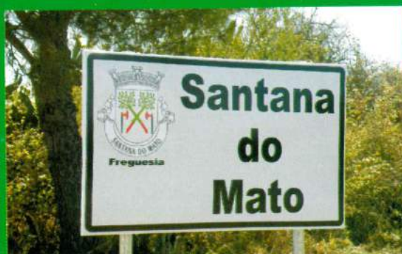
Placas Identificação Localidade - Santana do Mato