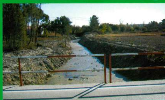
Pontão Brejoeira - Limpeza de Vala