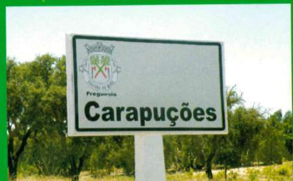
Placas Identificação Localidade - Carapuções