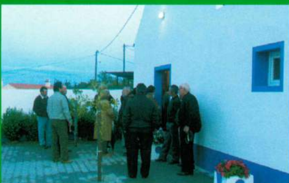
Capela Mortuária Santana do Mato - Construção (Depois)