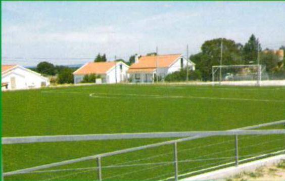
Relvado Sintético - Campo Atlético Ajuda - Santana do Mato