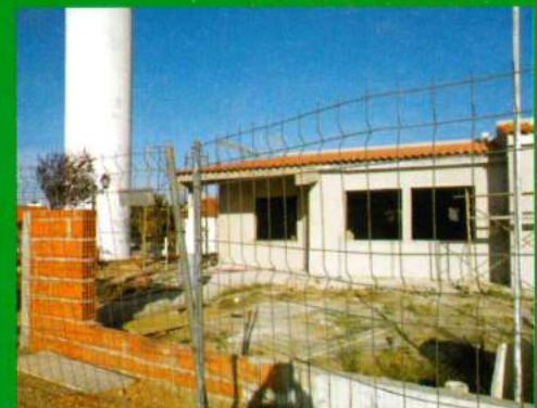
Inst. Edifício Sede / Obras de Reconstrução