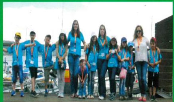
ATL de Verão - Parceria da Freguesia de Santana do Mato / ARCD Santa Ana - 2013