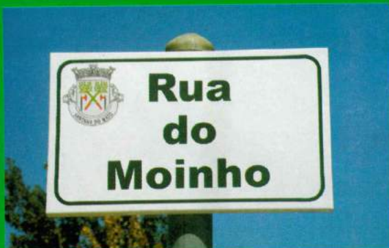
Placas Identificação Ruas - Brejoira