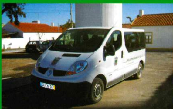
2.º Viatura de Transporte Escolar - Adquirida em 2006