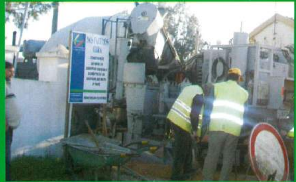
Av. 25 de Abril - Santana do Mato - Rede de Esgotos