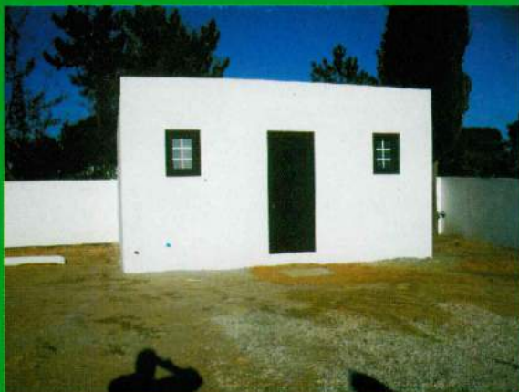
Construção WC - Cemitério Carapuções