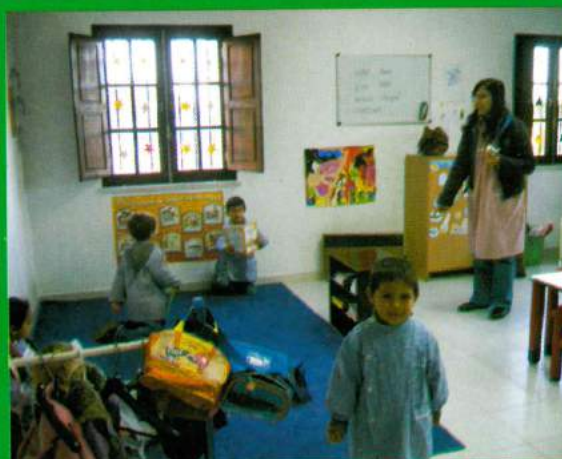
ATL - Parceria do Município de Coruche / Freguesia de Santana do Mato / ARCD Santa Ana