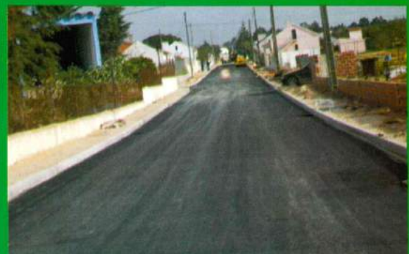
Av. 25 de Abril - Santana do Mato - Asfaltamento