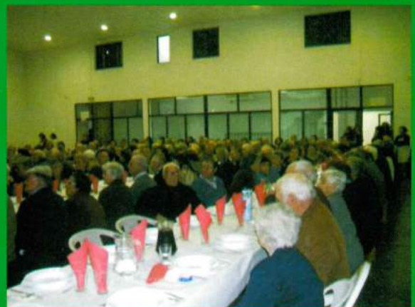
Almoço anual de reformados - 28 de Novembro de 2010