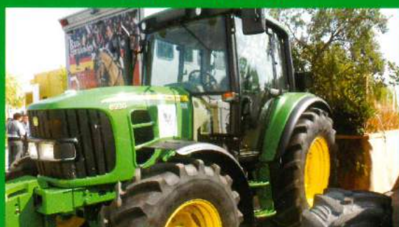
Tractor - Conservação e reparação de estradas, etc. Viatura Adquirida em 2009