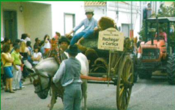
Participação no Cortejo / Festas do Castelo 2010