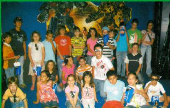
ATL de Verão - Parceria da Freguesia de Santana do Mato / ARCD Santa Ana - Visitas - 2009