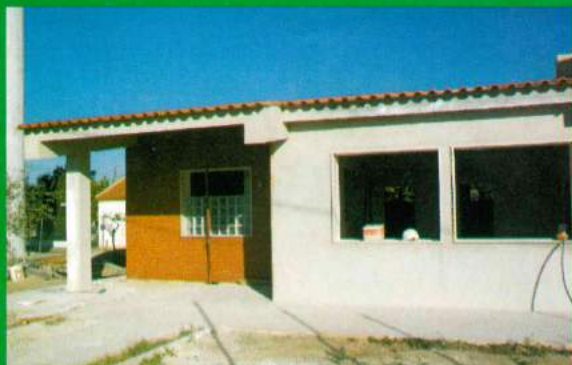
Recuperação do Edifício da Sede