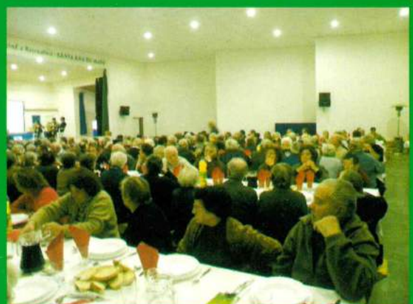
Almoço anual de reformados - 27 de Novembro de 2011