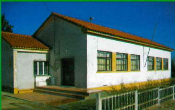
Igreja e Casa Mortuária - Carapuçães (Antes)