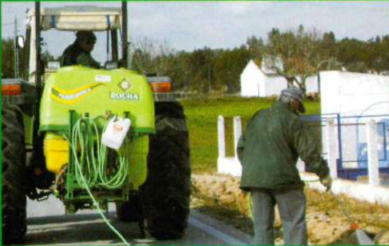
Aplicação de Erbicidas