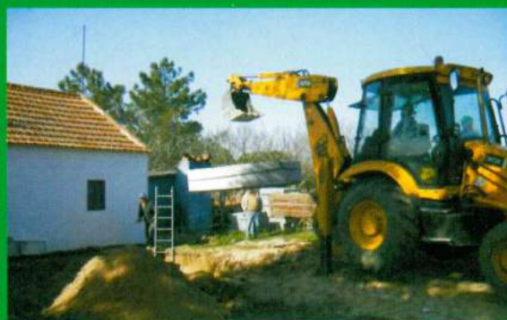
Fossas - Construção - Santana do Mato