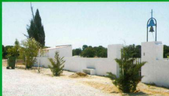
Cemitério Carapuções - Pintura, Plantação de Árvores e Reordenamento do Espaço