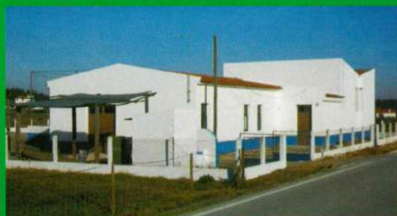
Grande Reparação do Centro Social Carapuções/ Brejoeiro - Colocação de Portas, Janelas e Pintura