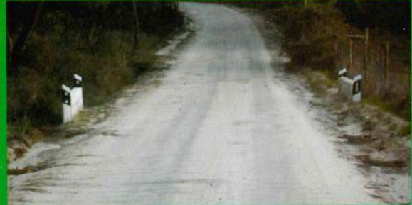
Pontão Brejeira - Rua das Amoreiras Construção de Paredes, Reflectores e Pintura