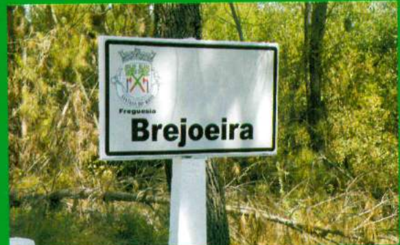
Placas Identificação Localidade - Brejoira