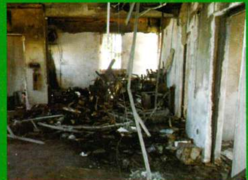
Ed. Sede (Interior) / Depois do Assalto - Incêndio