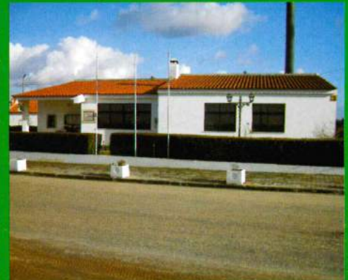
Edifício Sede / Antes do Assalto - Incêndio