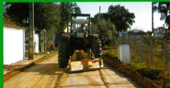
Conservação Ruas - Santana do Mato