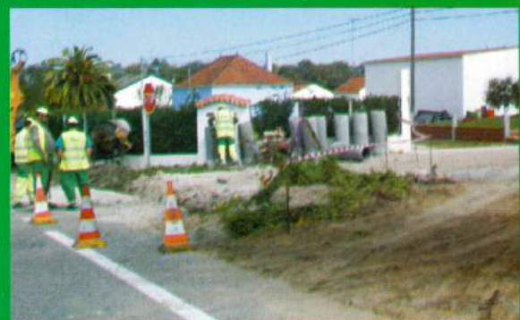
Regularização Águas Pluviais - EN 114 - Santana do Mato