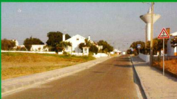
Av. Liberdade - Santana do Mato Regularização do piso e passeios