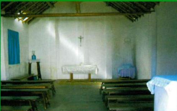
Capela Mortuária Santana do Mato - Construção (Antes)