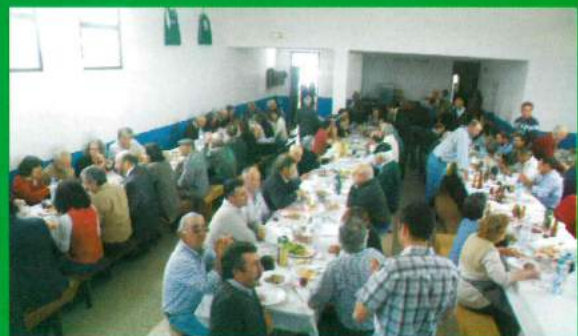
25 de Abril - Almoço C. Social Carapuções