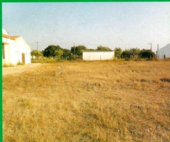
Terreno Junto ao Centro Social Futuras Instalações – Garagem/Arrecadação - Freguesia Santana Mato