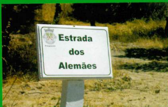
Placas Identificação Ruas - Carapuções