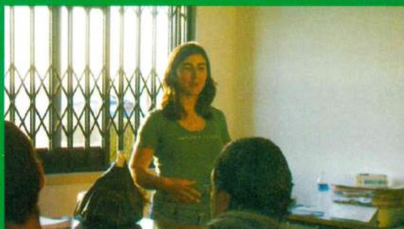
Protocolo - Escola Secundária Coruche / Freguesia de Santana do Mato - Novas Oportunidades 9 e 12.º Ano