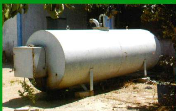
Aquisição de Depósito Combustível