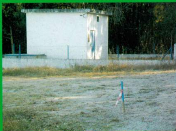
Construção de Depósito Apoiado Carapuções – Melhoramento na rede de abastecimento de Água