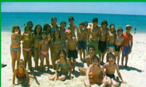
ATL de Verão - Parceria da Freguesia de Santana do Mato / ARCD Santa Ana - Viagens à Praia - 2009