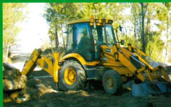
Pontão Rua Pinheiro - Carapuções (Início das Obras)