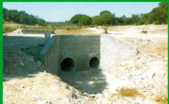
Construção do Pontão Terrafeito - Santana do Mato