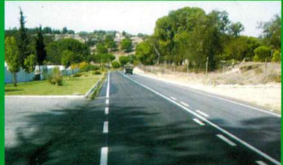
Asfaltamento Rua Santa Ana - Santana do Mato