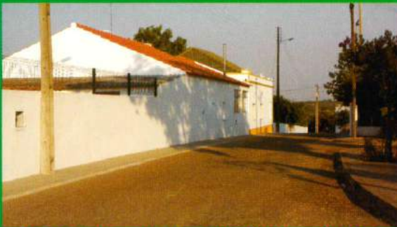
Rua Escolas e Av. Liberdade - Santana do Mato Regularização Águas Plúvias