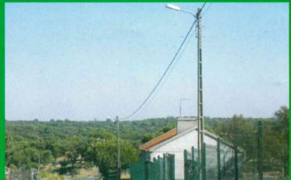
Reforço da Iluminação Pública - Vários Locais Santana do Mato / Carapuções / Brejoeira