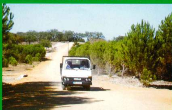
Viatura Nissan - Transporte de Pessoal, Materiais, etc