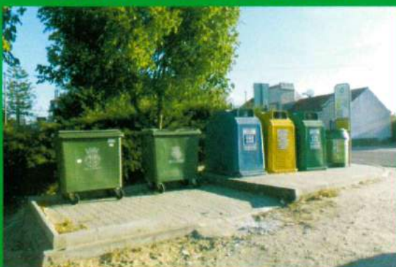
Ecoponto - Santana do Mato