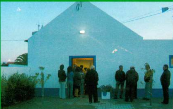
Capela Mortuária Santana do Mato - Construção (Depois)