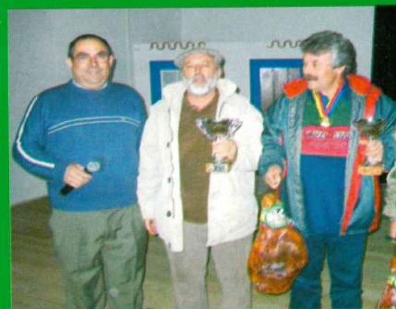
Parceria ARCD Santa Ana - Torneio de Sueca