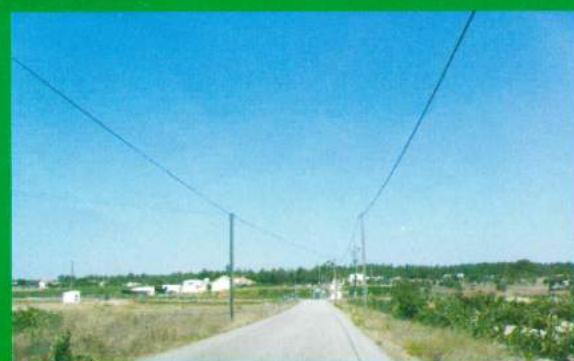
Asfaltamento Rua 1.º Dezembro - Carapuções