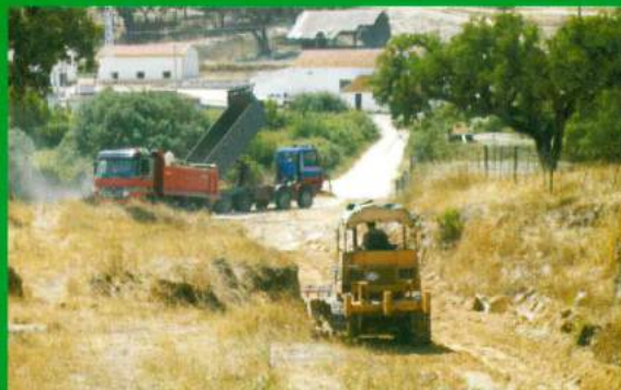
Reabertura da Estrada Carapuções - Estação de Lavre