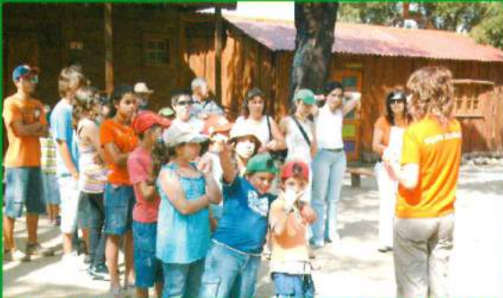
ATL de Verão - Parceria da Freguesia de Santana do Mato / ARCD Santa Ana 2007