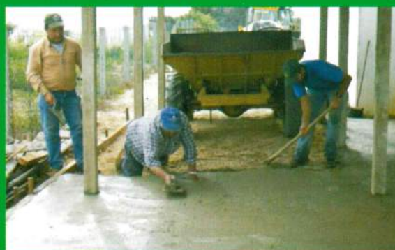
Alpendre - Centro Social - Santana do Mato