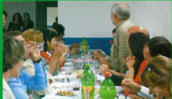
25 de Abril - Almoço C. Social Carapuções