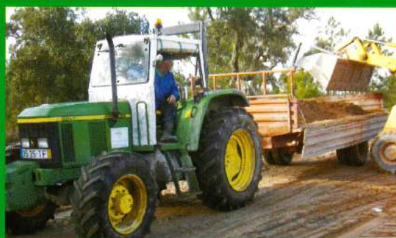
Tractor - Conservação e reparação de estradas, etc. Viatura Adquirida em 2002