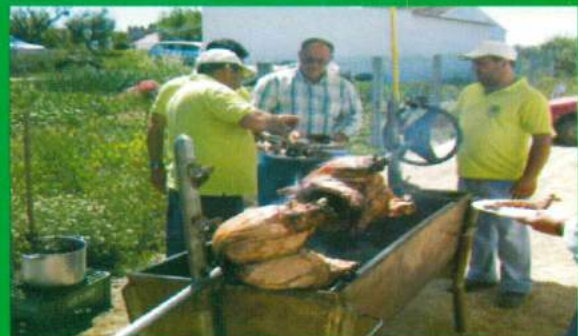
25 de Abril - Almoço C. Social Santana