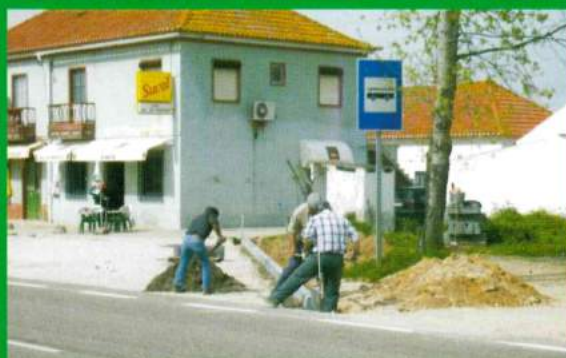
Regularização Piso - Café Sul Ribatejo - Santana do Mato