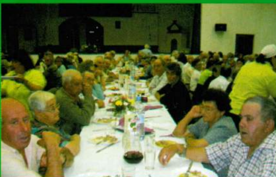
Almoço anual de reformados - 21 de Outubro de 2007