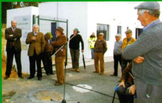
ETAR - Santana do Mato - Inauguração