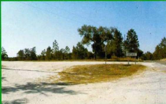
EN 114 / Estrada Poços - Reordenamento Acesso