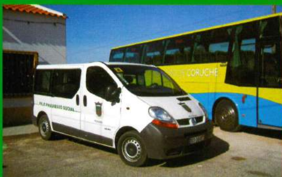
1.º Viatura de Transporte Escolar - Adquirida em 2003