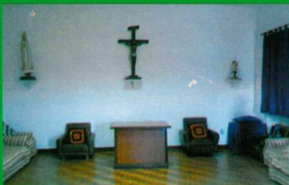
Interior Capela Mortuária - Carapuçães