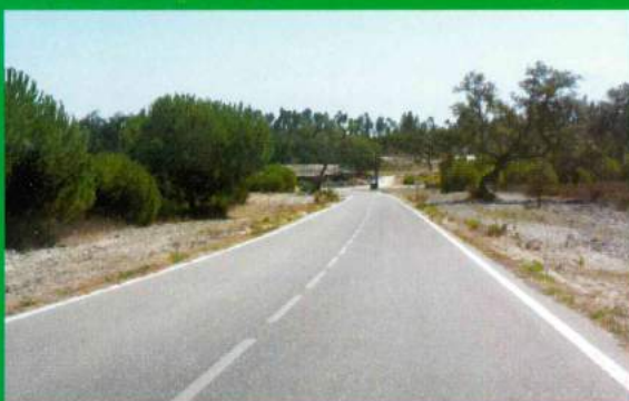
Asfaltamento Estrada dos Alemães - Carapções