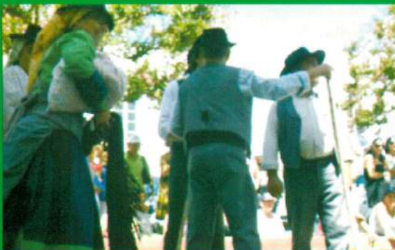
Participação no Cortejo / Festas do Castelo 2012