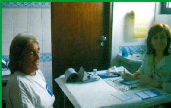
Protocolo - Farmácia Freitas / Freguesia de Santana do Mato Testes Colesterol, Diabetes, Medicamentos, etc