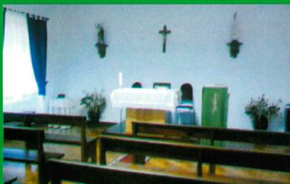
Interior da Igreja - Carapuçães