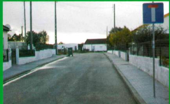
Rua 1.º Dezembro - Santana do Mato - Asfaltamento/Rede Esgotos