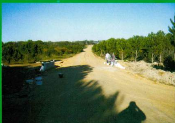
Construção do Pontão dos Poços Colocação de Reflectores e Pintura Regularização da Estrada