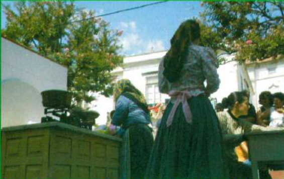
Participação no Cortejo / Festas do Castelo 2009