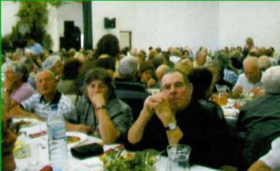
Almoço anual de reformados - 25 de Setembro de 2005