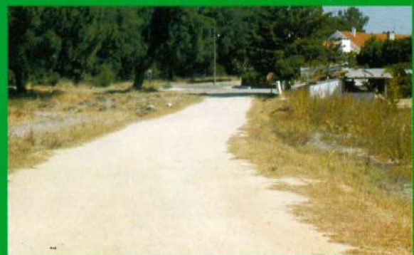
Reparação do Caminho - Rua 1.º Maio / Maria Cabeça / Redonda