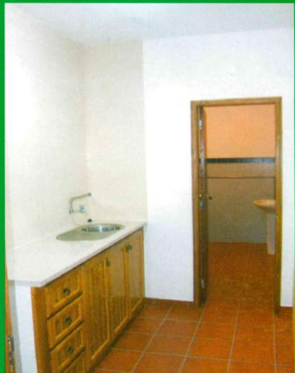
Capela Mortuária Santana do Mato - Construção (Depois) Instalações Sanitárias