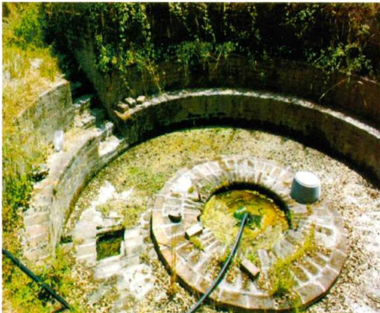
Furo Herdade da Afeiteira

A Freguesia de Santana do Mato em 1822, tinha 89 fogos e cerca de 300 habitantes